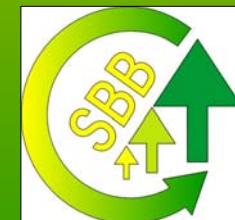
Stichting voor Bosbeheer en Bostoezicht