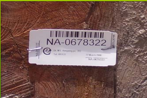
Figuur 2: SBB label