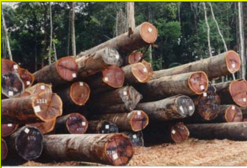
Figuur 1: Commercieel hout op een landing

De Stichting voor Bosbeheer en Bostoezicht (SBB) heeft als doel het bevorderen van een duurzame en optimale benutting van de bossen van Suriname op domeingrond in het algemeen en van de voor houtproductie bestemde bossen in het bijzonder door toepassing van de richtlijnen in de Wet Bosbeheer (1992) en andere relevante wetten en regelgeving.